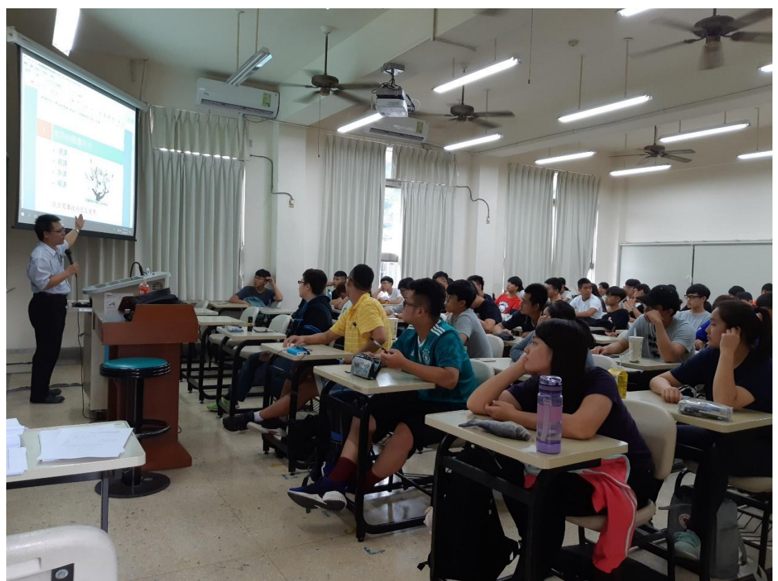
教師融入閱讀與新聞稿單元教學