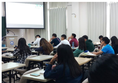
說明：同學認真聽講