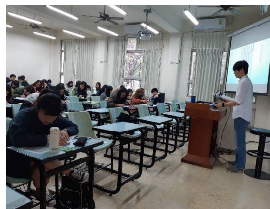
說明：台下同學認真撰寫應徵函