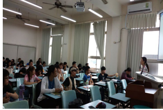
說明：台下同學認真構思主題