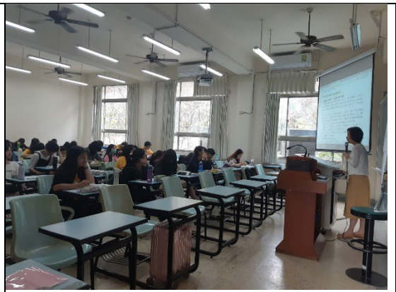
說明：台下同學認真聽講