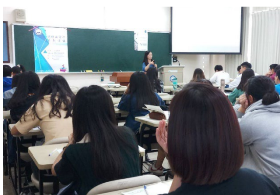
說明：說明敘事原理