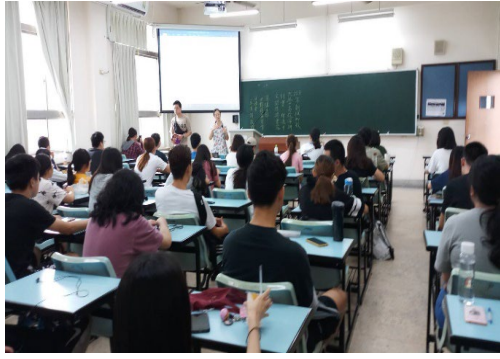
說明：台下同學認真聽講