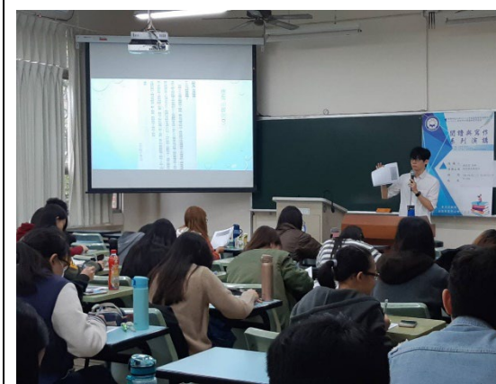
說明：台下同學認真聽講