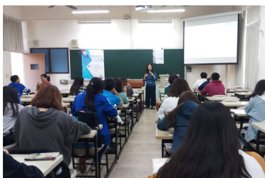
說明：問答互動教學