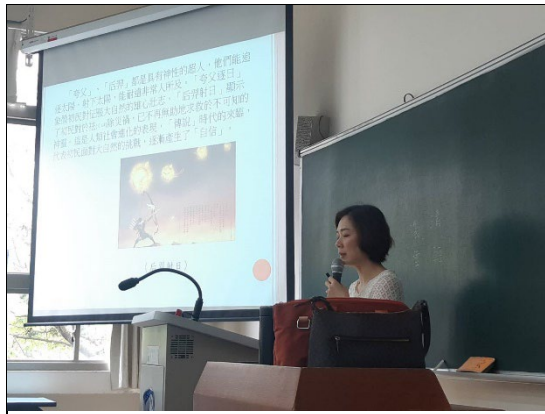
說明：講師講解中國神話及傳說的差異