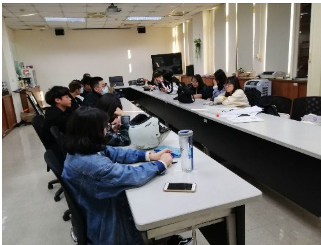
補救教學—以團體指導方式提升書寫能力