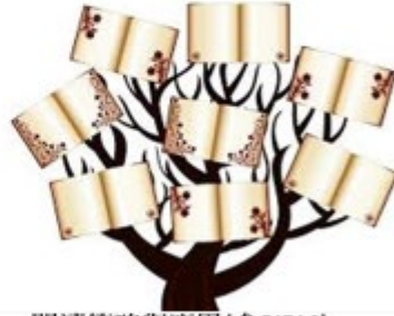
閱讀策略與應用(參PIRLS)