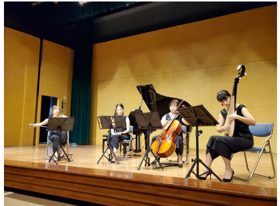
說明：植心樂集演奏查爾達斯