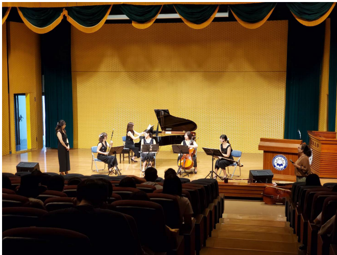
說明：植心樂集分享平常的練習過程