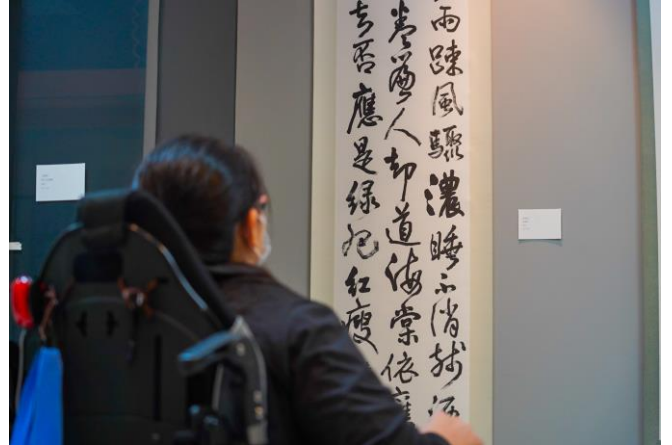
說明：同學專心欣賞作品