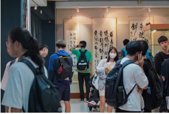
說明：現場參觀展覽的情形