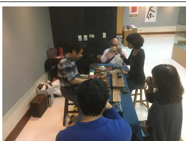
說明：學校教職員工品茶體驗