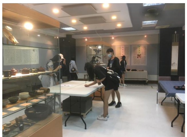
說明：學生參觀情況