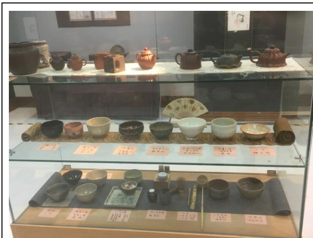
說明：日本茶碗、抹茶器具區