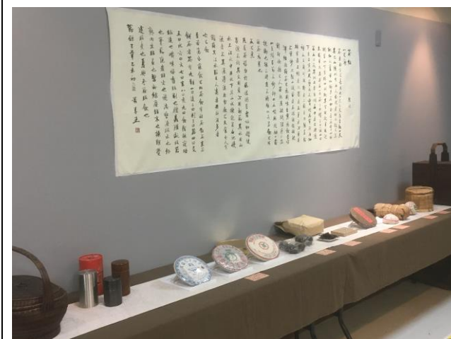
說明：普洱茶、白茶、綠茶區