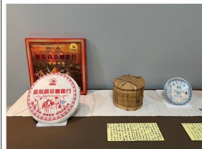
說明：普洱茶區及講解說明。