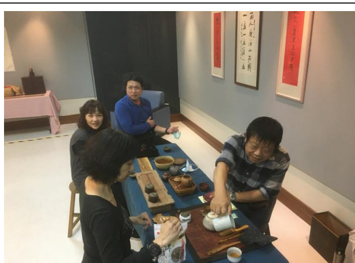
說明：總務處職員午休時間蒞臨參訪。