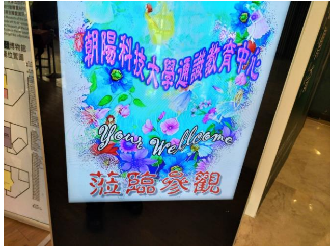
說明：歡迎朝陽師生參訪